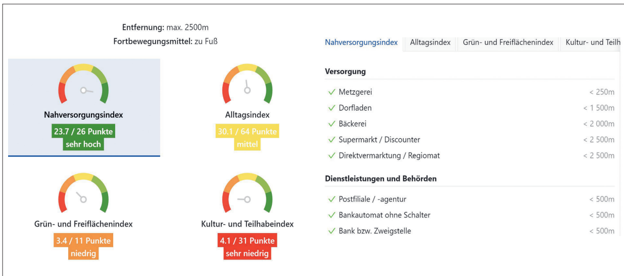
Abb. 2: Visualisierung von Indikatoren zur Ausstattungsqualität der Daseinsvorsorge in der KFMplus

Die Software wird flurstücksbezogen mit Kartengrundlagen (Luftbilder, topografische Karten) und Fachdaten (z. B. Bebauungspläne, Hochwassergefahrenkarten, Denkmalschutz, Demografie, Flächennutzung) so weit wie möglich vorbefüllt. Sie stellt darüber hinaus Eingabemasken zur Erfassung weiterer Informationen zur Verfügung (z. B.